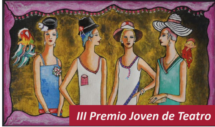
III Premio Joven de Teatro